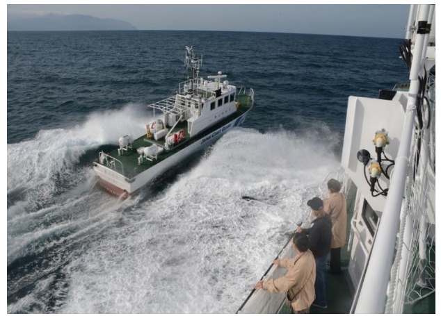
巡視艇はまなす高速機動訓練・放水訓練