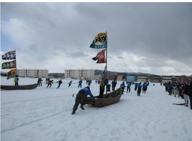
惜しくも僅差で敗退 (お疲れ様でした)

友の会合同チームは選手、応援含めて25名が参加 留萌高校サッカー部との1回戦 序盤リードも後半失速して1回戦敗退 巡視船ちとせチームは見事準優勝しました。