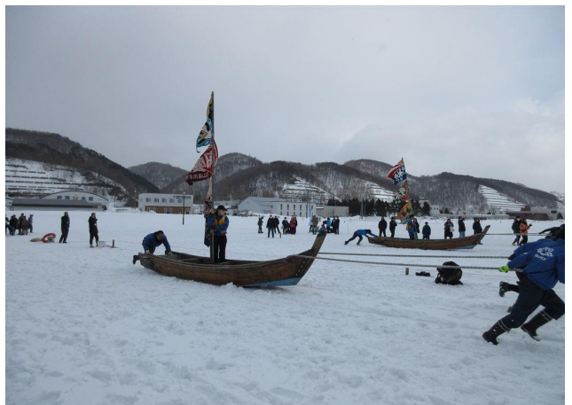
力の限り引っ張っています。