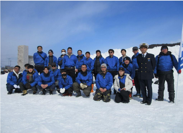
レース前の集合写真 (皆さん元気です)