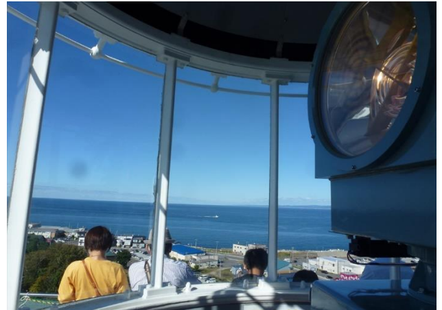
増毛灯台から市内が一望 天売島、焼尻島も見えました