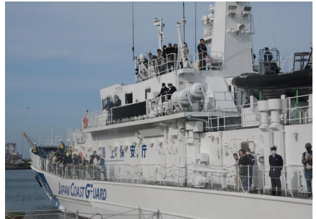
巡視船ちとせ体験航海の様子